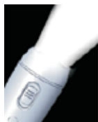
Lampe de panne de Courant