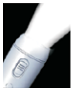
Lampe de panne de Courant